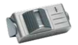
VK 2122 Funk-Bewegungsmelder, batteriebetrieben, aluminium