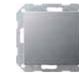
VK 2666-WS-AL Gira Wechselwippe, aluminium