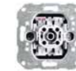
VK 2665-WE Wipptaster-Einsatz, Schließer 1-polig