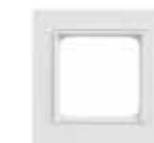
VK 2660-UW Gira System 55 (Serie E2) Abdeckrahmen inkl. Zwischen- rahmen, 1-fach, ultraweiß