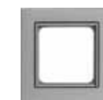
VK 2660-AL Gira System 55 (Serie E2) Abdeckrahmen inkl. Zwischen- rahmen, 1-fach, aluminium