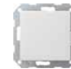
VK 2666-WS-UW Gira Wechselwippe, ultraweiß