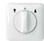
VK 2780-UW Jalousieschalter, UP, beidseitige Tast- und Rast- funktion, 1-polig, ultraweiß