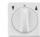
VK 2784-UW Jalousieschalter, AP, beidseitige Tast- und Rast- funktion, 1-polig, ultraweiß