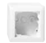
VK 2664-1-UW Gira System 55 (Serie Standard 55) Aufputzgehäuse, 1-fach, ultraweiß